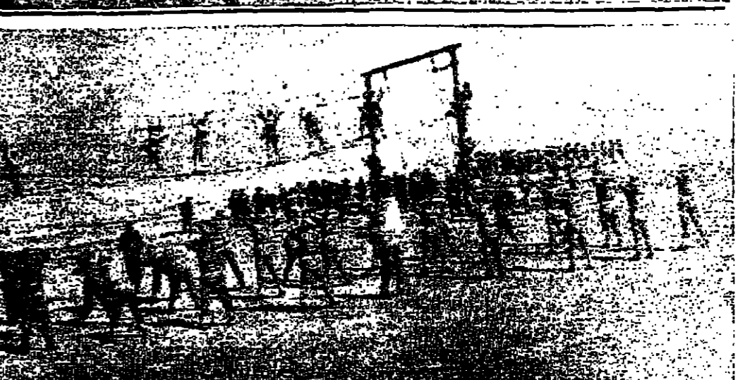
بنين اشمارون الجنية الصعبة التي يتلقاها الكفون بالخدمة الوطنية لكي يكونوا في المستقبل في مستوى معركة العودة